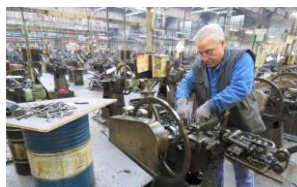
Atelier de clous en activité