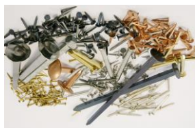
2800 références de clous

Matin vers Creil (60) visite de l'usine « clouterie Rivierre » depuis 1888.